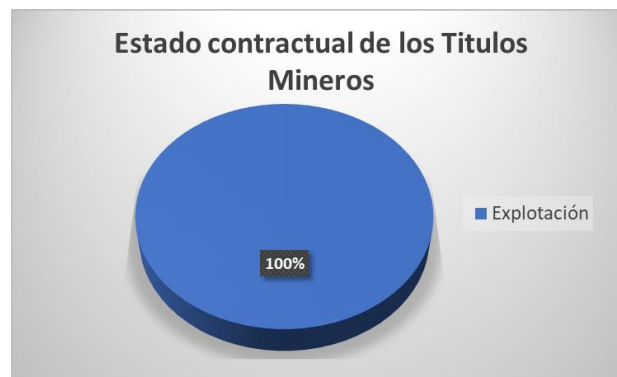
TABLA No. 10