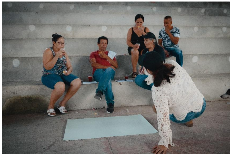
Espacio de cartografía social en la vereda Isaza (Victoria, Caldas), 22 de abril de 2024

La cartografía social es una de las metodologías que se utiliza para abrir los espacios de encuentro comunitario, buscando establecer principales inquietudes, requerimientos y aspectos positivos manifestados por la comunidad. Dentro de estos ejercicios de cartografía social se trabaja sobre el reconocimiento del territorio, los intereses de las comunidades y percepciones con relación a la actividad minera.