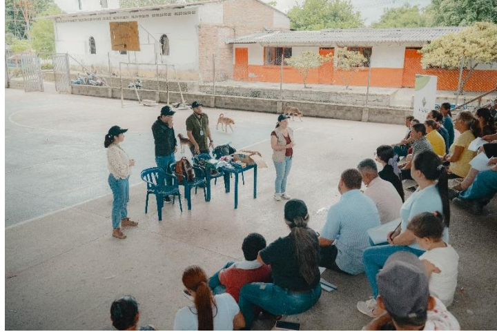
Cartografía social Izasa Victoria 08_04_2024