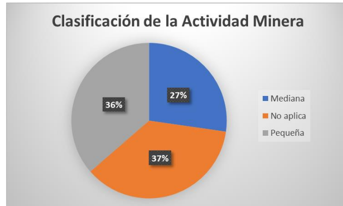
TABLA No. 6