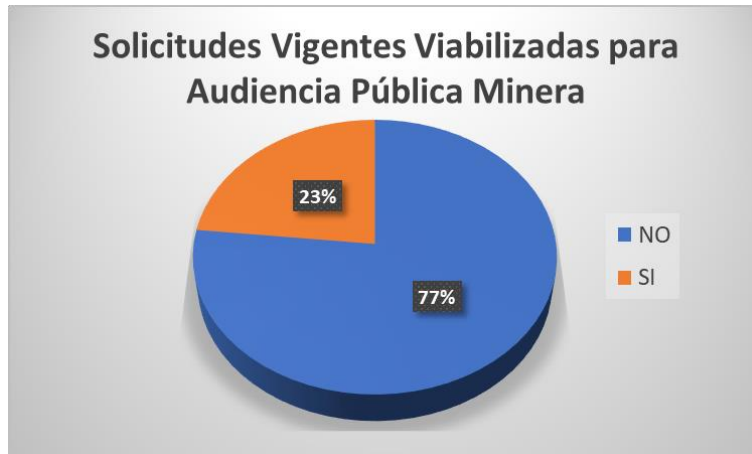
TABLA No. 13