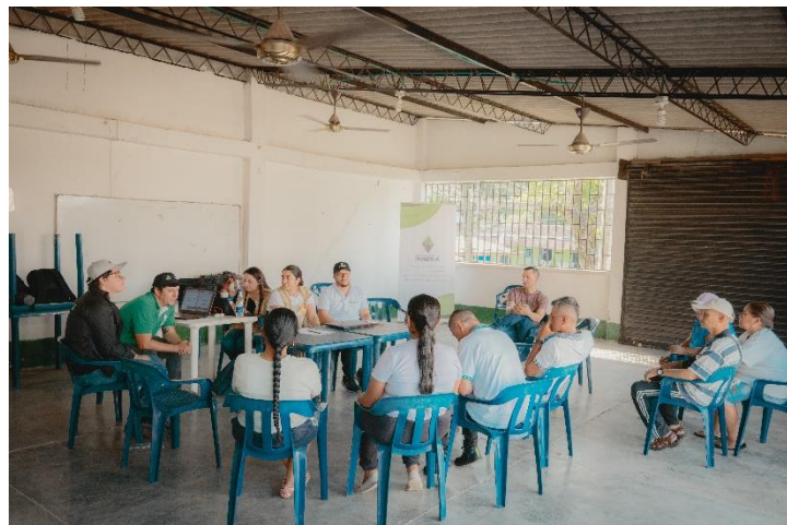
Dialogo mixto mayo_2024