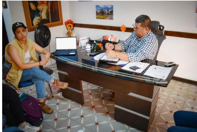
Acercamiento a la alcaldía de Victoria Caldas_20_03_2024