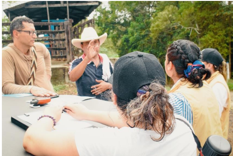
Dialogo con comunidad y proponentes Marzo_2024

La fase de aproximación con el territorio es el primer acercamiento que realiza el equipo implementador del proceso de audiencias públicas mineras, en la que se realiza la visita a los lugares donde están las solicitudes viabilizadas para el posible otorgamiento de títulos mineros, se realiza el primer dialogo con autoridades territoriales, para dar a conocer el proceso de APM, diálogos con organizaciones sociales, y demás actores identificados en el municipio.