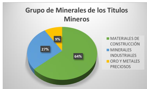
GRÁFICO No 7