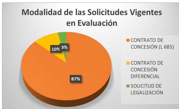
GRÁFICO No 10