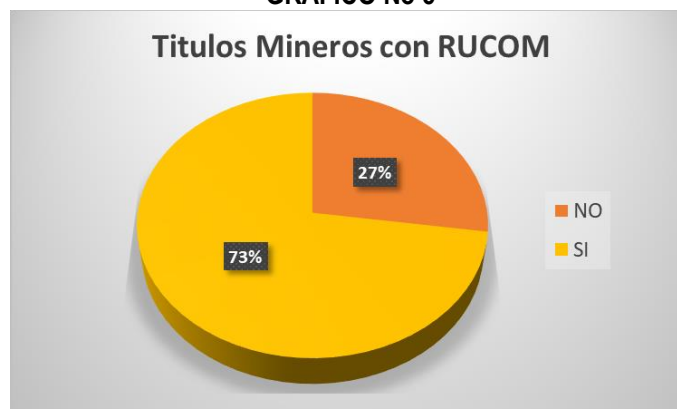
GRÁFICO No 5