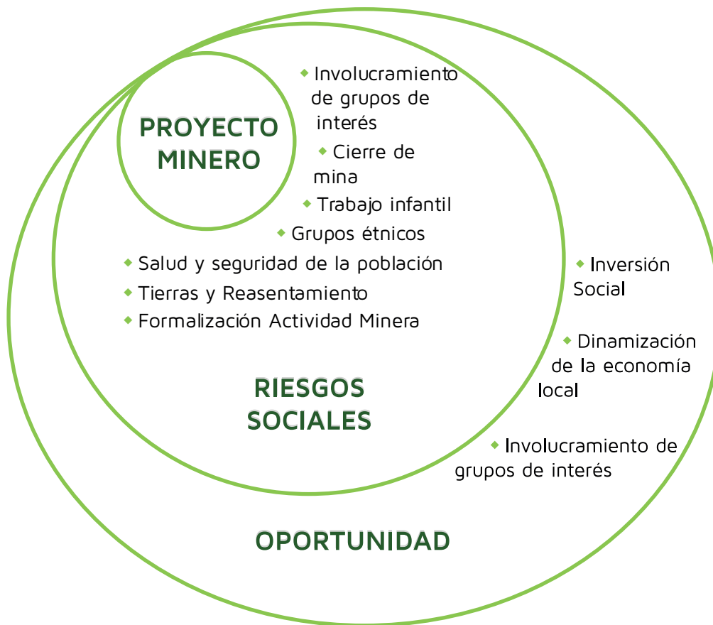
Gráfica 1: Riesgos y oportunidades de la operación minera

La gráfica número 1 muestra los asuntos clasificados por esferas: riesgos y oportunidades, tomando en cuenta que el Involucramiento con Grupos de Interés es transversal a las dos esferas.